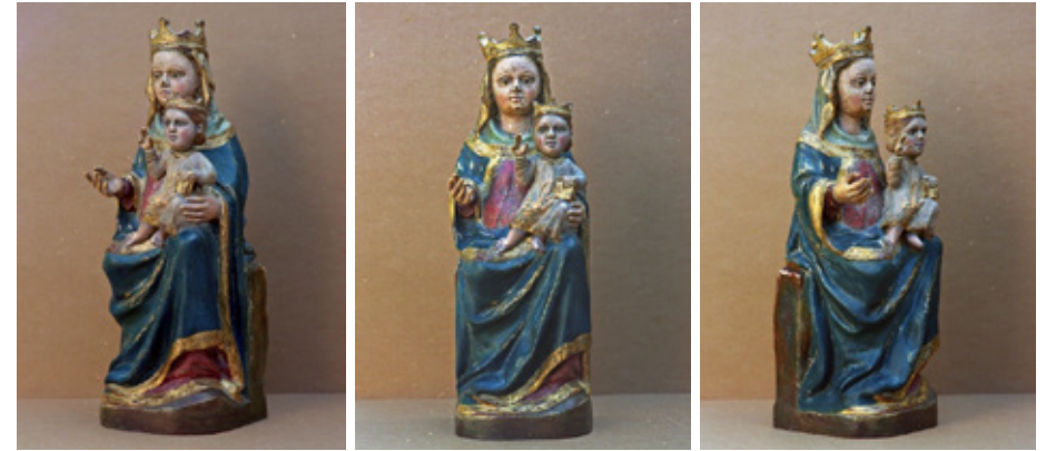
Mare de Déu de Consolació

Si amb amor sou invocada que ragi la vostra amor, Fonament, Pedra Assentada de la Consolació ... 2