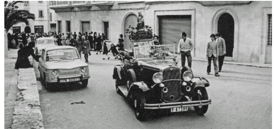
Trasllat de la imatge de la Mare de Déu de Consolació al Santuari

Una sèrie de persones i de circumstàncies, com molt bé va deixar reflectit Miquel Pons a les Notes històriques sobre el Santuari 4 van fer que la primitiva i actual imatge, el 8 de desembre de 1972, festa de la Puríssima, Nostra Dona Maria de Consolació, amb tota la solemnitat, tornàs a ca seva des de Santanyí, fent voltera per s'Alqueria Blanca i Pou del Rei, fins a la llar enlairada, després de